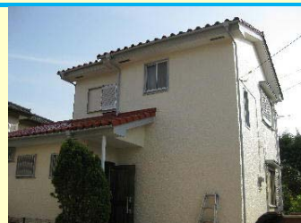
鶴ヶ島市藤金 A 邸