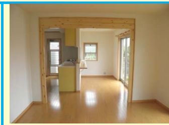
狭山市柏原ニュータウン K 邸